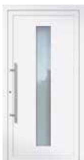
Höhe | Hauteur 2.000 mm

Die Originalabbildungen im Prospekt entsprechen einer Türgröße von 1.100 x 2.100 mm. Die Motivgrößen (Glasfelder) bleiben in der Höhe immer gleich und werden nicht individuell angepasst. Entsprechend wird bei abweichendem Höhenmaß der obere oder untere verbleibende Füllungsrand kleiner bzw. größer.