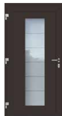
Innenseite / Vue intérieur